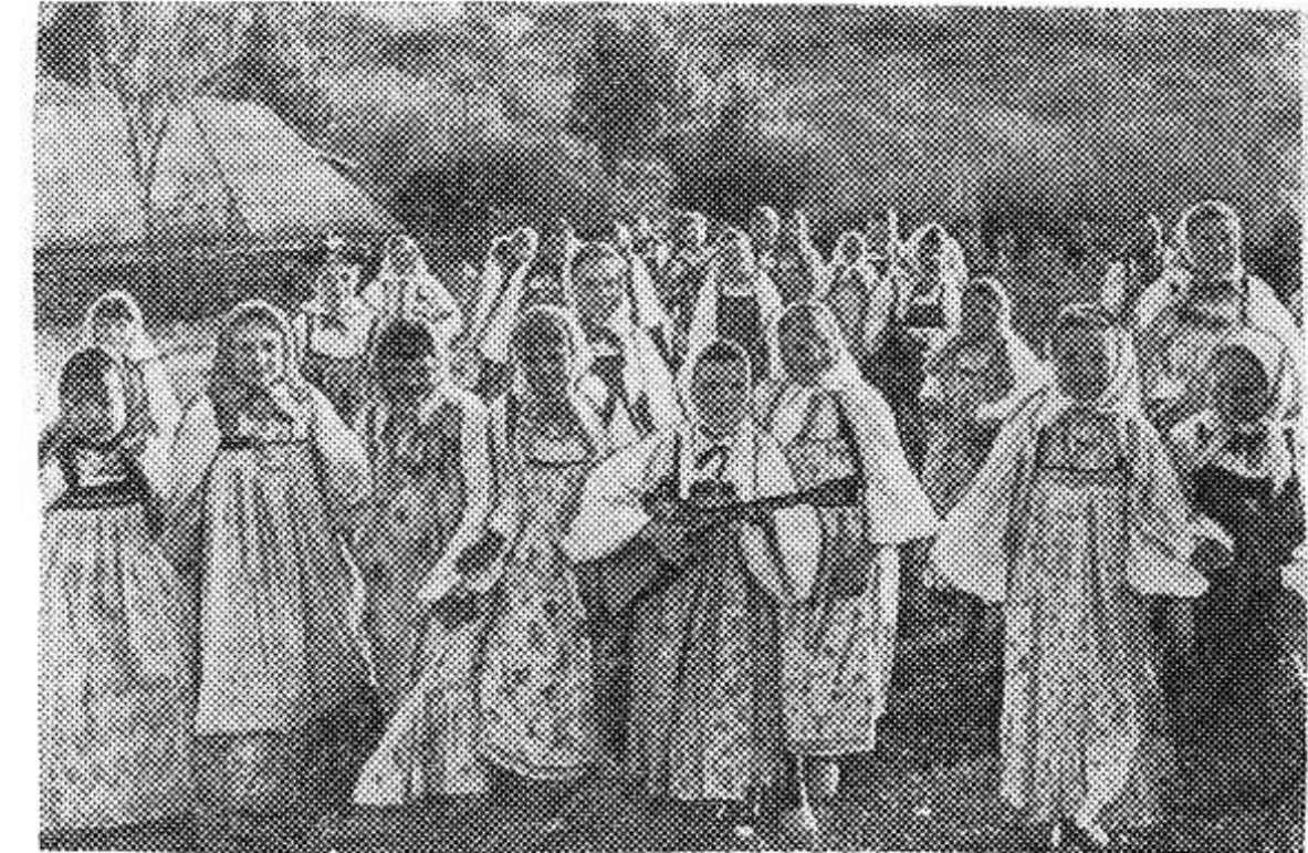
Курская область. Самодельный коллектив села Будичи — неоднократный участник смотров народных талантов. Здесь зародился веселый хор «Тимоша», который сейчас выступает во многих местах под аккомпанемент народных инструментов. В селе ревностно хранят традиции отцов и дедов, и в этом большая заслуга энтузиаста художественной само-

Начало сеансов в 17, 19 и 21 час. ДОМ КУЛЬТУРЫ Художественный фильм «НОКТЮРН» Начало сеансов в 18 и 20 часов.