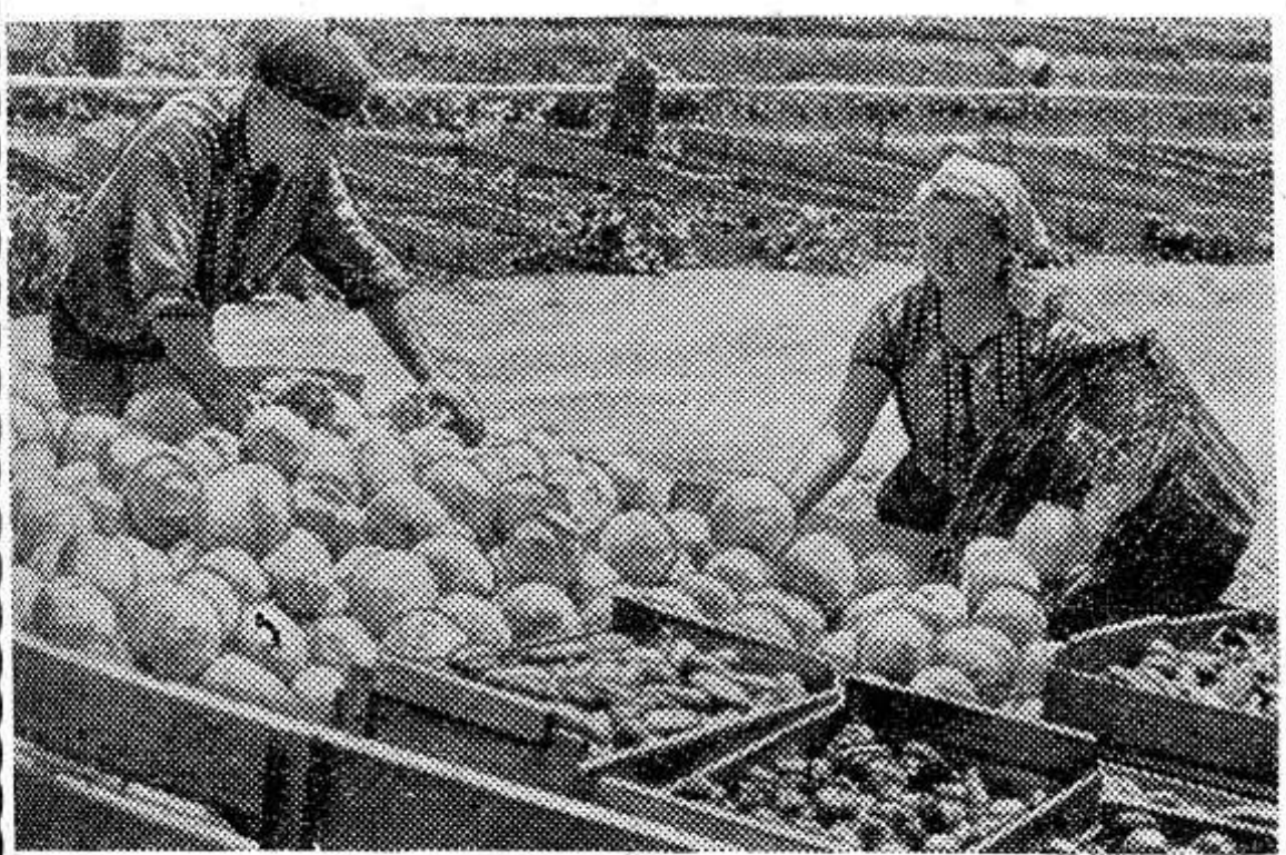
ЗАКАРПАТСКАЯ ОБЛАСТЬ. Десятки машин с огурцами и помидорами, перцем и капустой, морковью и петрушкой идут из колхоза имени XXII съезда КПСС Мукачевского района. «Овощи в ассортименте» получают торгующие организации промышленных центров. Колхоз реализовал уже в этом году около четырех тысяч центнеров овощей.

Идут колонны в снежно-белых костюмах с голубыми флагами и флагами стран-участниц фестиваля. А следом в нарушение «алфавитной очереди» первыми вступают на беговую дорожку делегации Северного и Южного Вьетнама. (Окончание на 4-й стр.)