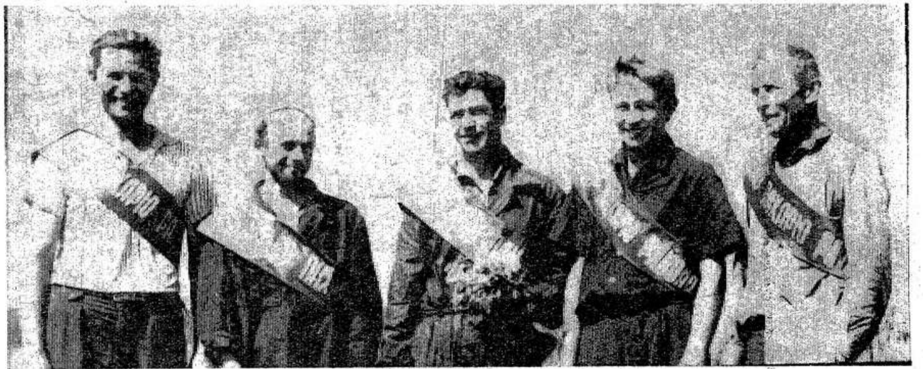
Фото и текст Ю. Орлова.

В исполкоме райсовета и райкоме профсоюза