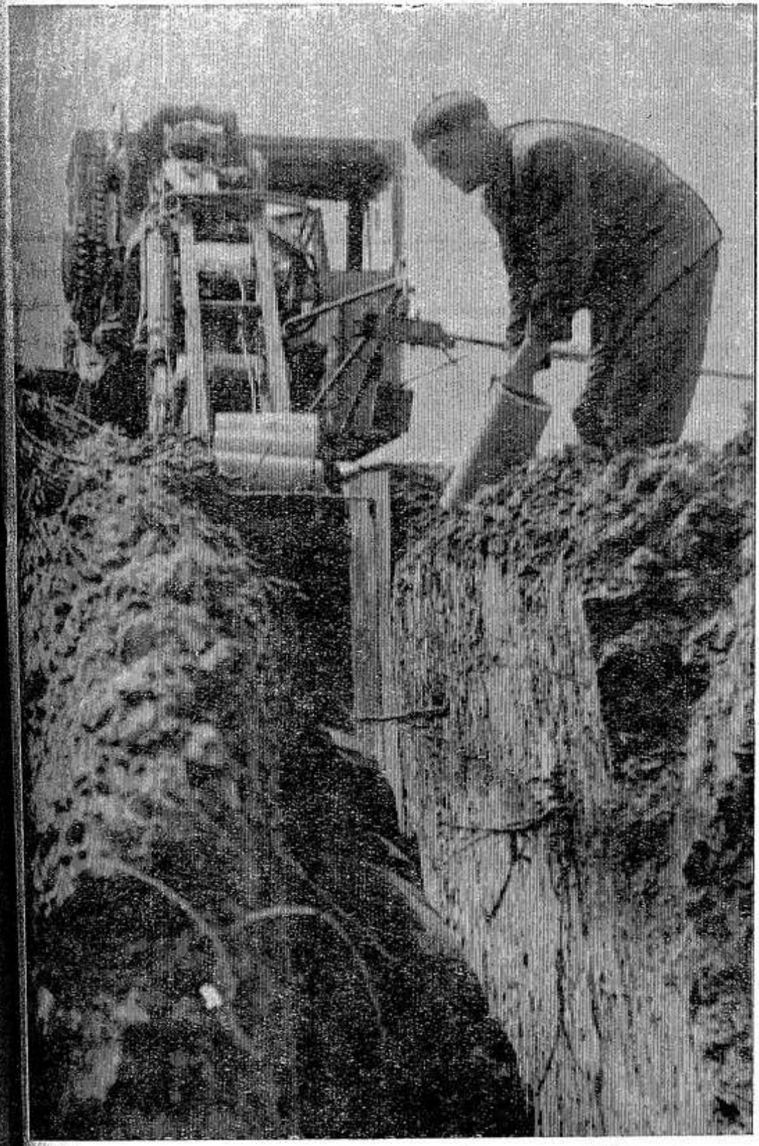
На снимке: строительство закрытой дренажной сети в колхозе «Путь к коммунизму».