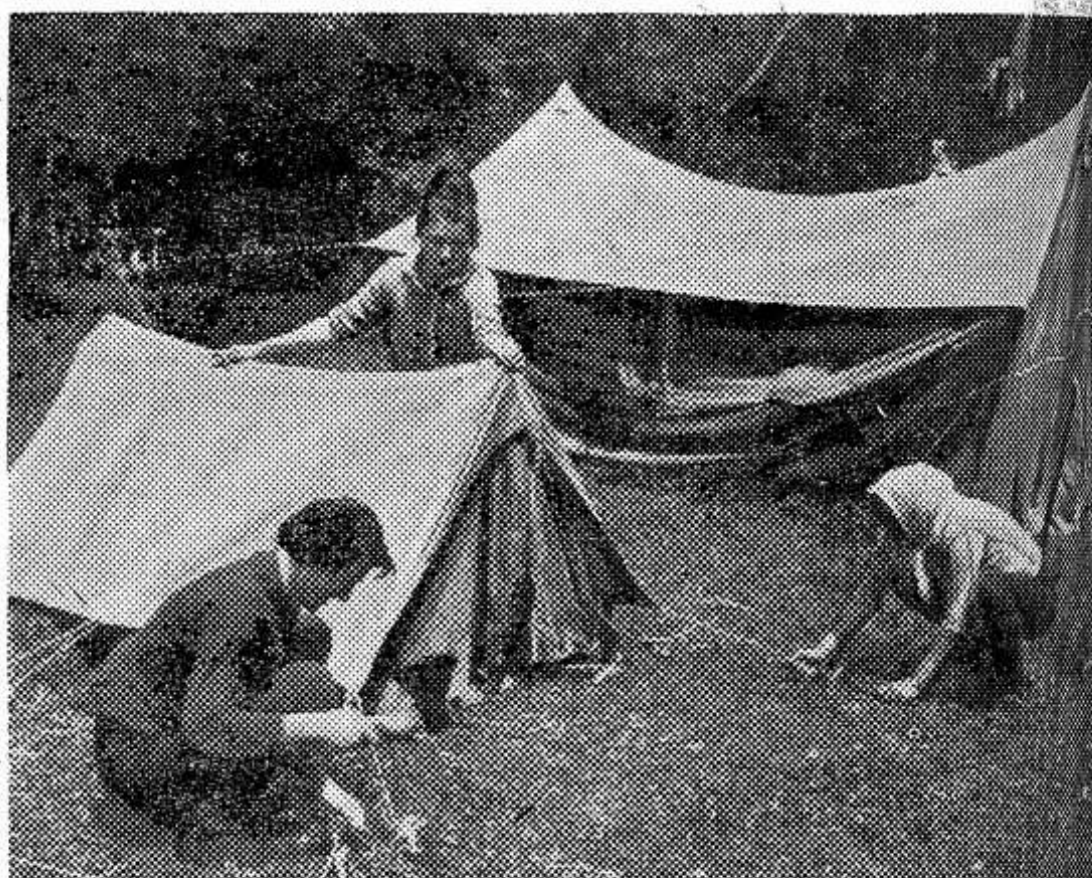
ДАГЕСТАНСКАЯ АССР. Учащиеся школ и студенты города Буйнакса известны в республике как большие любители туризма. Во время своих походов по родному краю они собирают песни, легенды, разнообразный этнографический материал. НА СНИМКЕ: краеведы Буйнакса начали совершать первые походы. Установка палаток.