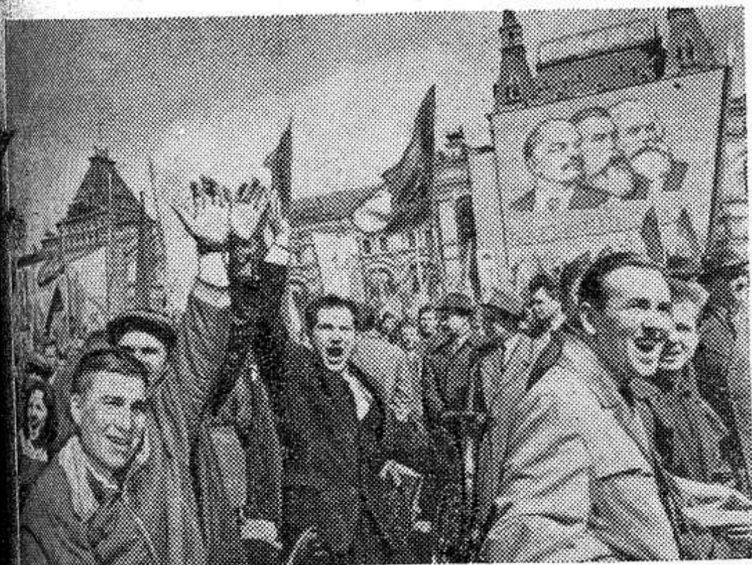
НА СНИМКЕ: в колонне демонстрантов на Красной площади.

Предложено каждому хозяйству подобрать и послать на стипендии колхозов и совхозов учащихся в культпросветшколы, техникумы и институты культуры.