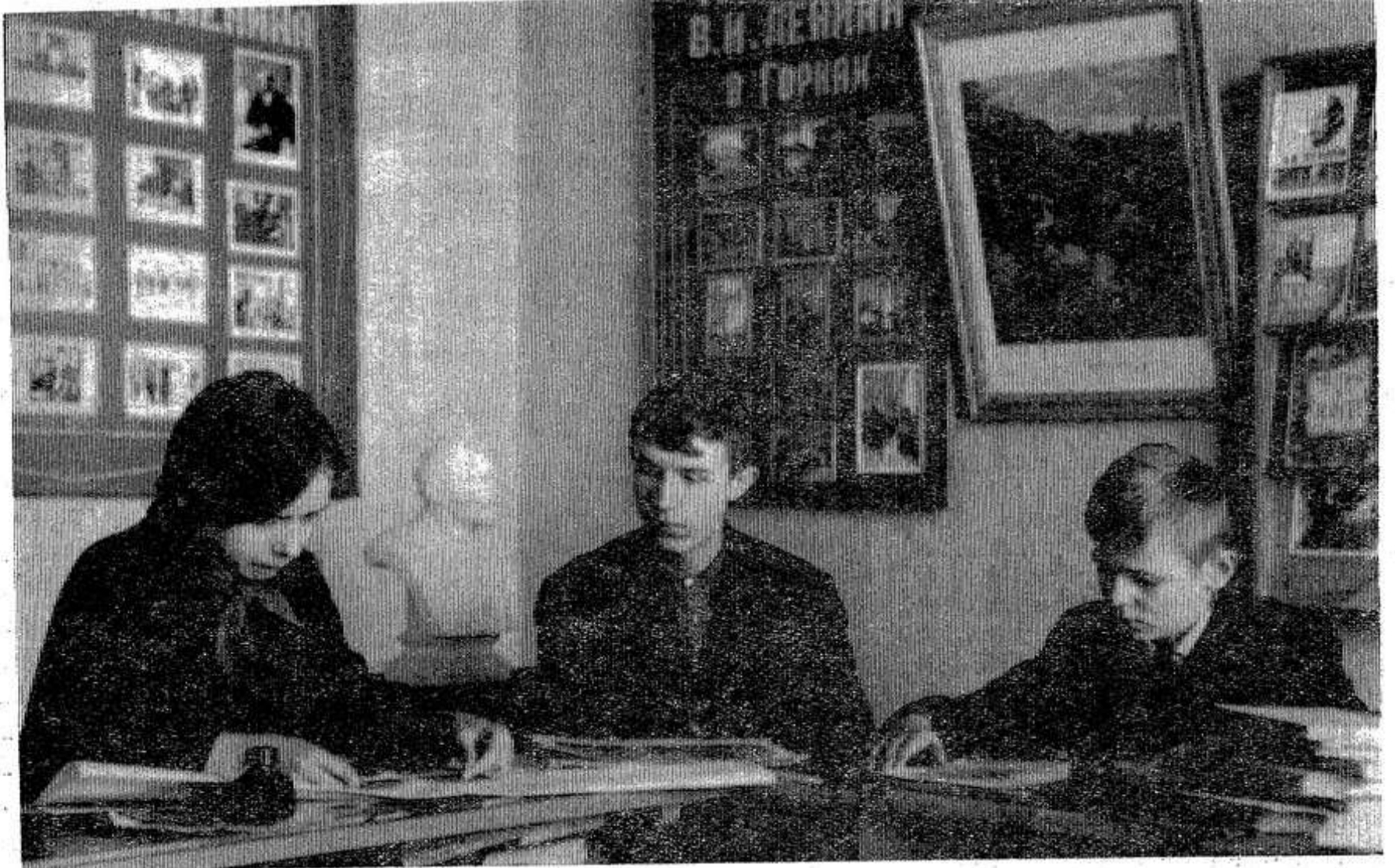
В Ленинской комнате интерната слабослышащих детей.