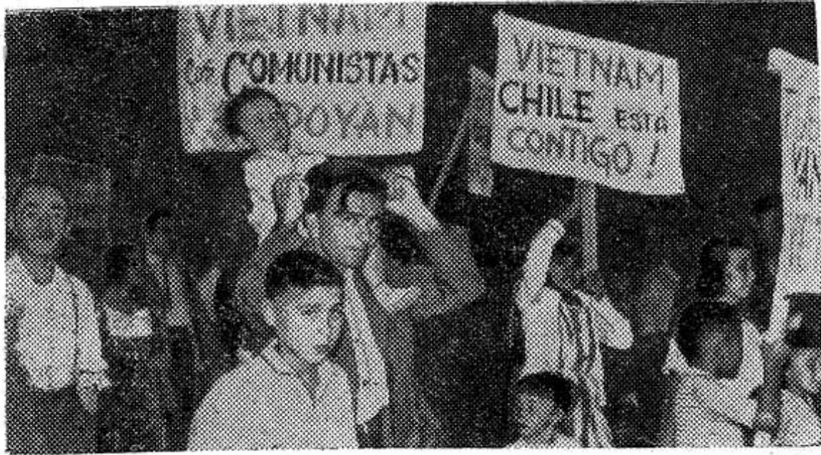
Во всем мире ширится движение против американской агрессии во Вьетнаме. Состоялась демонстрация и в Сант-Яго, чилийской столице. Демонстранты выразили свою солидарность с героическим борющимся народом Вьетнама, заявили протест против преступной агрессии американского империализма. Они несли плакаты с надписями: «Вьетнам, коммунисты поддерживают тебя», «Вьетнам, Чили с тобой!».