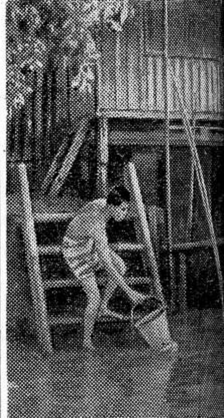
Жизнь миллионов тайландцев проходит на берегах рек и в лодках. Прямо в лодках и домах своих живут рыбаки и грузинцы со своими семьями.