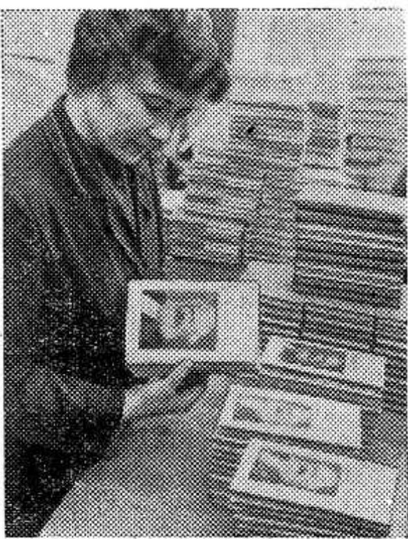
По сведениям Всесоюзной книжной палаты труда К. Маркса и Ф. Энгельса издавались в СССР 2,994 раза общим тиражом 85,428 тысяч экземпляров, на 77 языках.

М. Ностина, начальник автоколонны № 1300