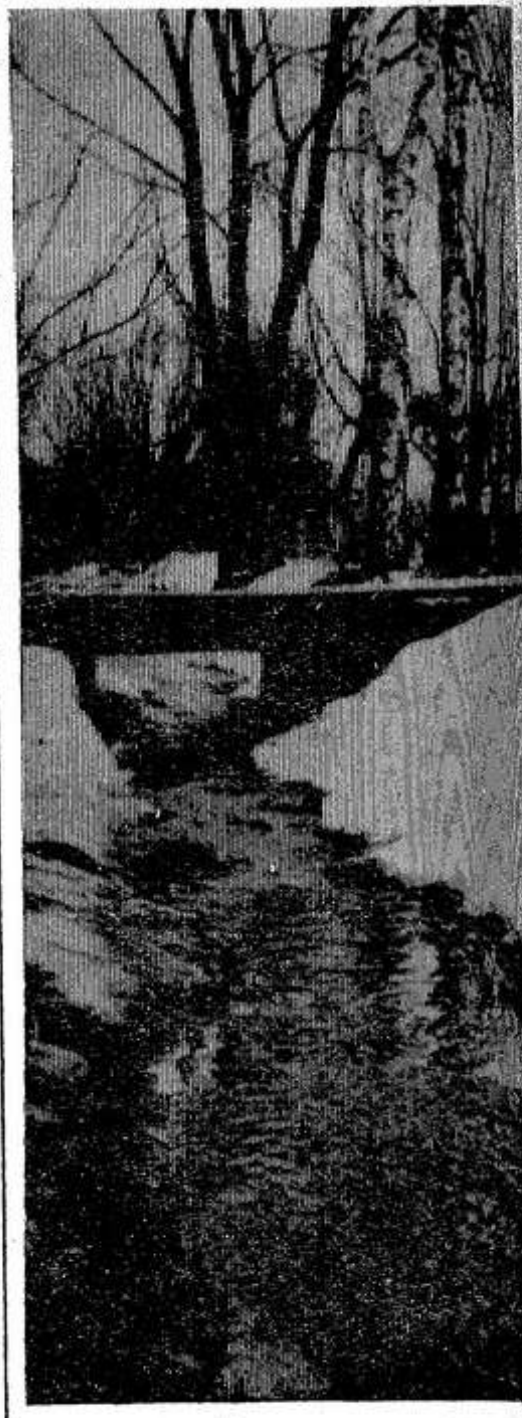
Бегут ручьи.