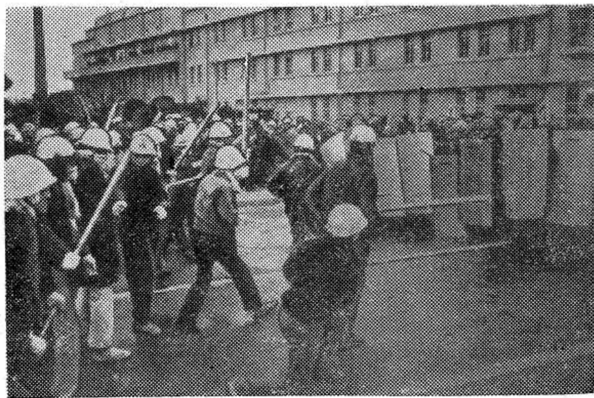
Тысячи представителей трудящихся по призыву социалистической, коммунистической партий и Генсовета профсоюзов Японии вышли на улицы городов, чтобы выразить протест против планов США, направленных на превращение Японии в ядерную базу американского империализма и форпост агрессии во Вьетнаме. НА СНИМКЕ: стычка демонстрантов с полицией.

ных на превращение Японии в ядерную базу американского империализма и форпост агрессии во Вьетнаме.