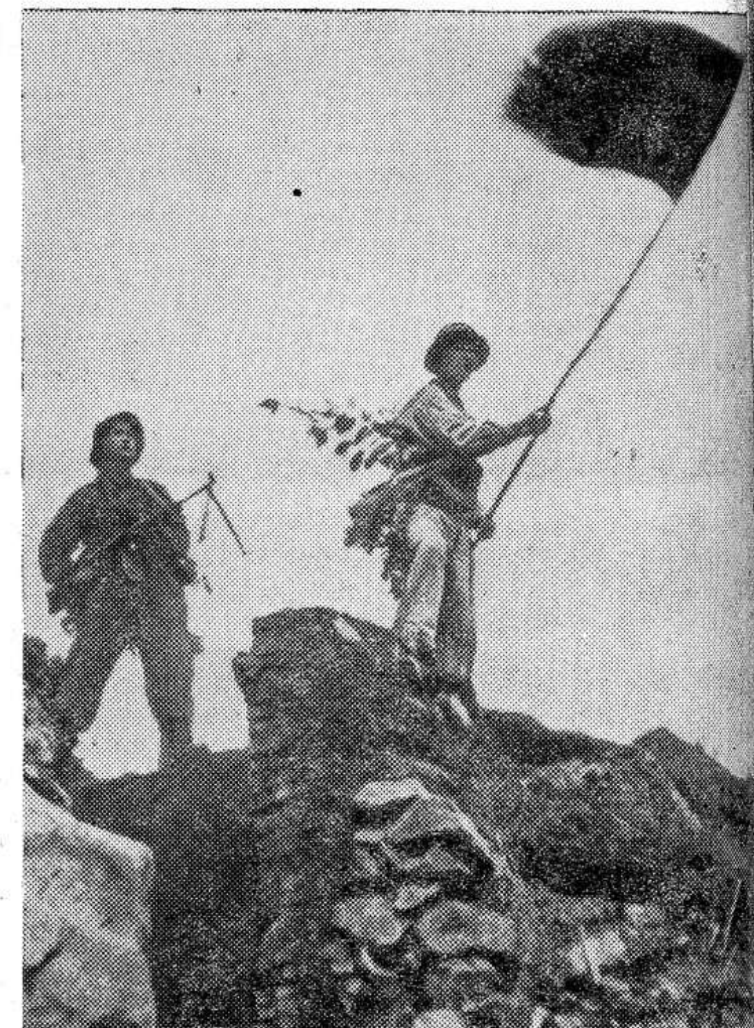
ЮЖНЫЙ ВЬЕТНАМ. Успешно завершена одна из атак бойцов Армии освобождения на позиции американской морской пехоты. Над вражеским редутом водружается флаг Национального фронта освобождения Южного Вьетнама.

Для охраны здоровья людей и продления срока хранения молока перед отпуском населению его подвергают тепловой обработке: пастеризации (нагревание до температуры 63—95 градусов) с после-