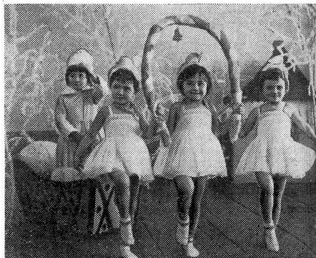
АЛТАЙСКИЙ КРАЙ. В детском саду совхоза «Новоалтаевский» — сто двадцать малышей. Хорошую программу подготовили дети к утреннику, на который пришли их мамы и папы.