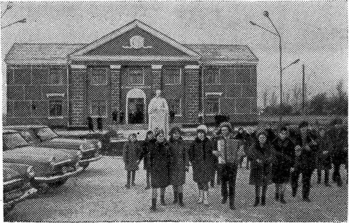
ВОЛЫНСКАЯ ОБЛАСТЬ. в селе Колодяжье Ковельского района гостеприимно распахнул двери Дом культуры. Здесь зрительный зал на 400