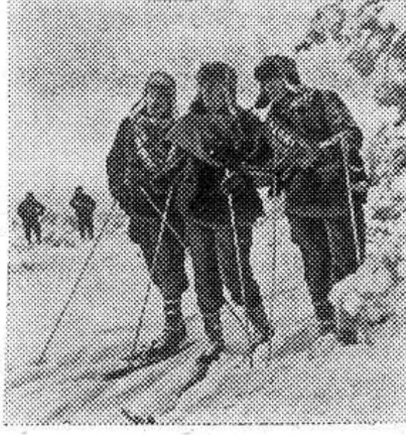
Самая трудная часть пути — 300 километров по тайге и бо-

Участники пробега посетят места боевых схваток отрядов Красной Армии и партизан с белогвардейцами и интервентами, встретятся с рабочими лесопромышленных предприятий, охотниками, рыбаками, звероводами — героями гражданской и Великой Отечественной войн.