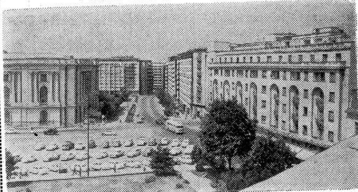
Бухарест. Площадь Республики.