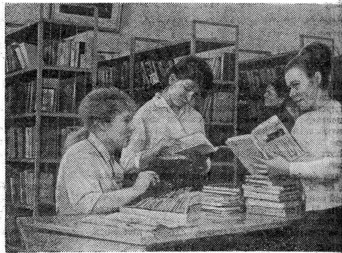
В сельхозартели имени Карла Маркса Плавского района Тульской области каждый колхозник пользуется услугами библиотеки, в которой насчитывается несколько тысяч книг.