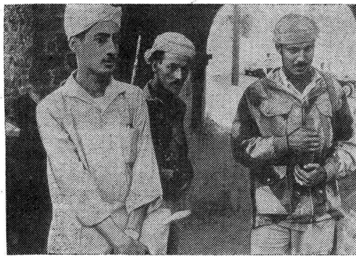
Народная Республика Южного Йемена — самая молодая в мире. Английское владычество, продолжавшееся 129 лет на юге Аравии, рухнуло в результате многолетней самоотверженной борьбы народа.

ЛУГАНСК. Первую продукцию отправил хозяйству области вступивший в строй Луганский комбикормовый завод. Предприятие оснащено новейшим технологическим оборудованием. Его производительность — более 300 тонн комбинированных кормов в сутки.