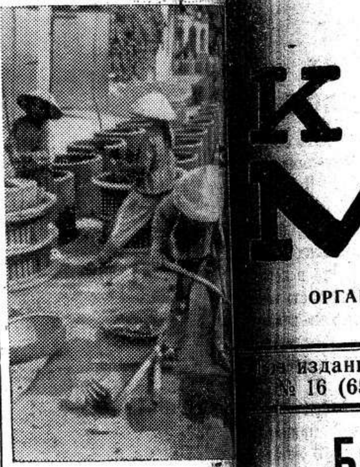
ДЕМОКРАТИЧЕСКАЯ ПУБЛИКА ВЬЕТНАМ. Многие тысячи укрытий, подобно этому, изготавливаются по всей стране. Каждое из них рассчитано на одного человека. Укрытия предназначены для защиты населения от варварских бомбардировок американской авиации.

Работники промышленности, транспорта, сельского хозяйства включились в социалистическое соревнование за достойную встречу 100-летия со дня рождения В. И. Ленина и досрочное выполнение пятилетки. Редакция надеется, что рабочие и сельские корреспонденты, читатели газеты будут сообщать о трудовом подъеме своих коллективов, обо всем том, что они считают нужным, интересным. Ждем от вас писем, корреспонденций, зарисовок, рассказов.