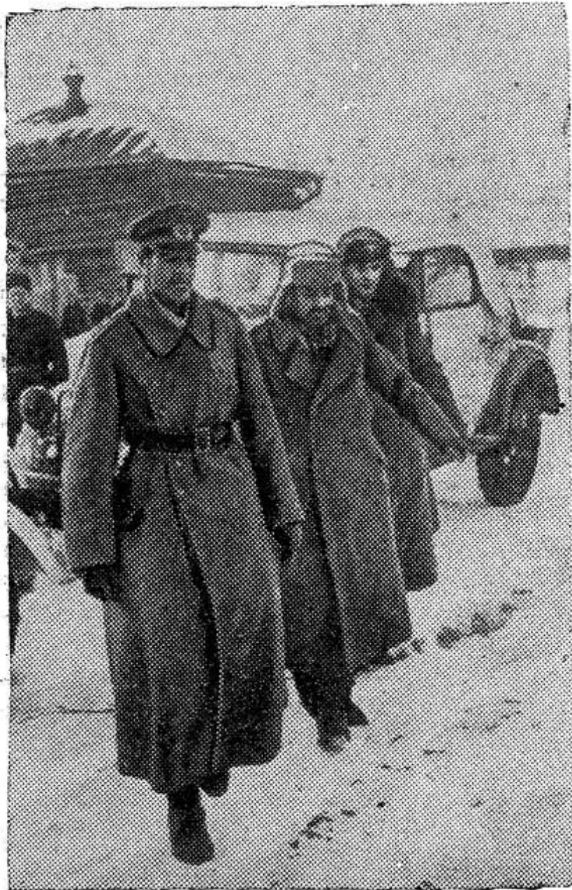
НА СНИМКАХ: слева — фельдмаршал Паулюс (крайний слева) взят советскими войсками в плен; справа — возрожденный из руин Сталинград (ныне Волгоград). Жилые дома на Аллее героев.