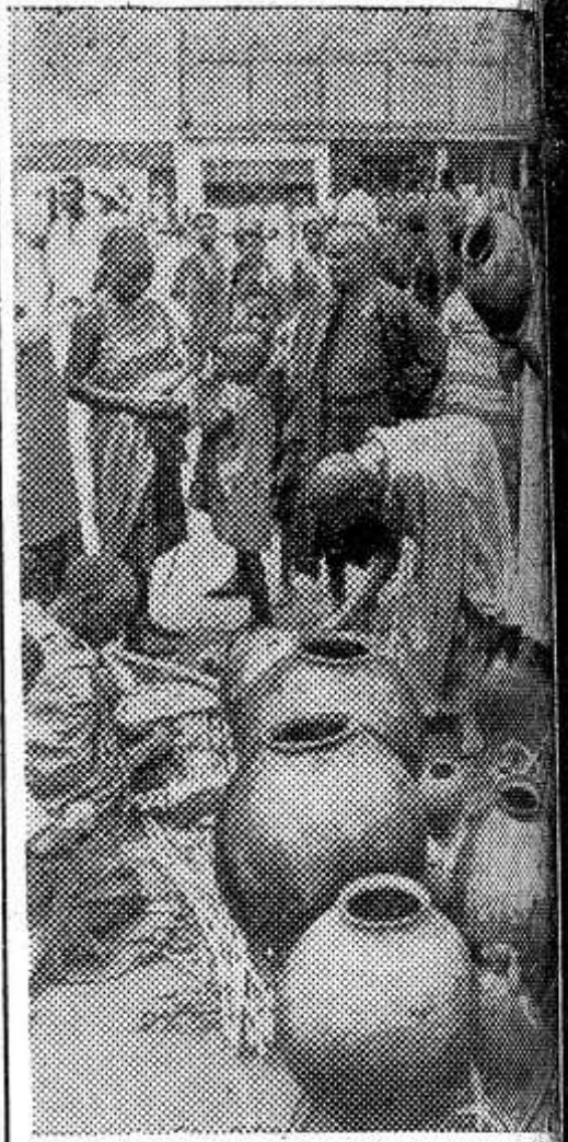
На всю Восточную и Центральную Африку славится бананы в бурундийском городке Китеге. куда в воскресные дни съезжаются свои изделия искусные гонимы из племени хуту. Из поколения в поколение передают хитрости изготовления огромных горшков, в которых хранят масло, растительное масло, яйца, но и другие продукты питания. Редкая африканская семья ходит в хозяйстве без тарелки горшка, купленного на базаре Китеге.