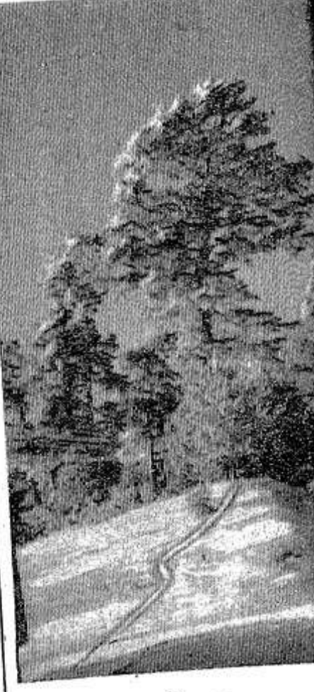
Зима.