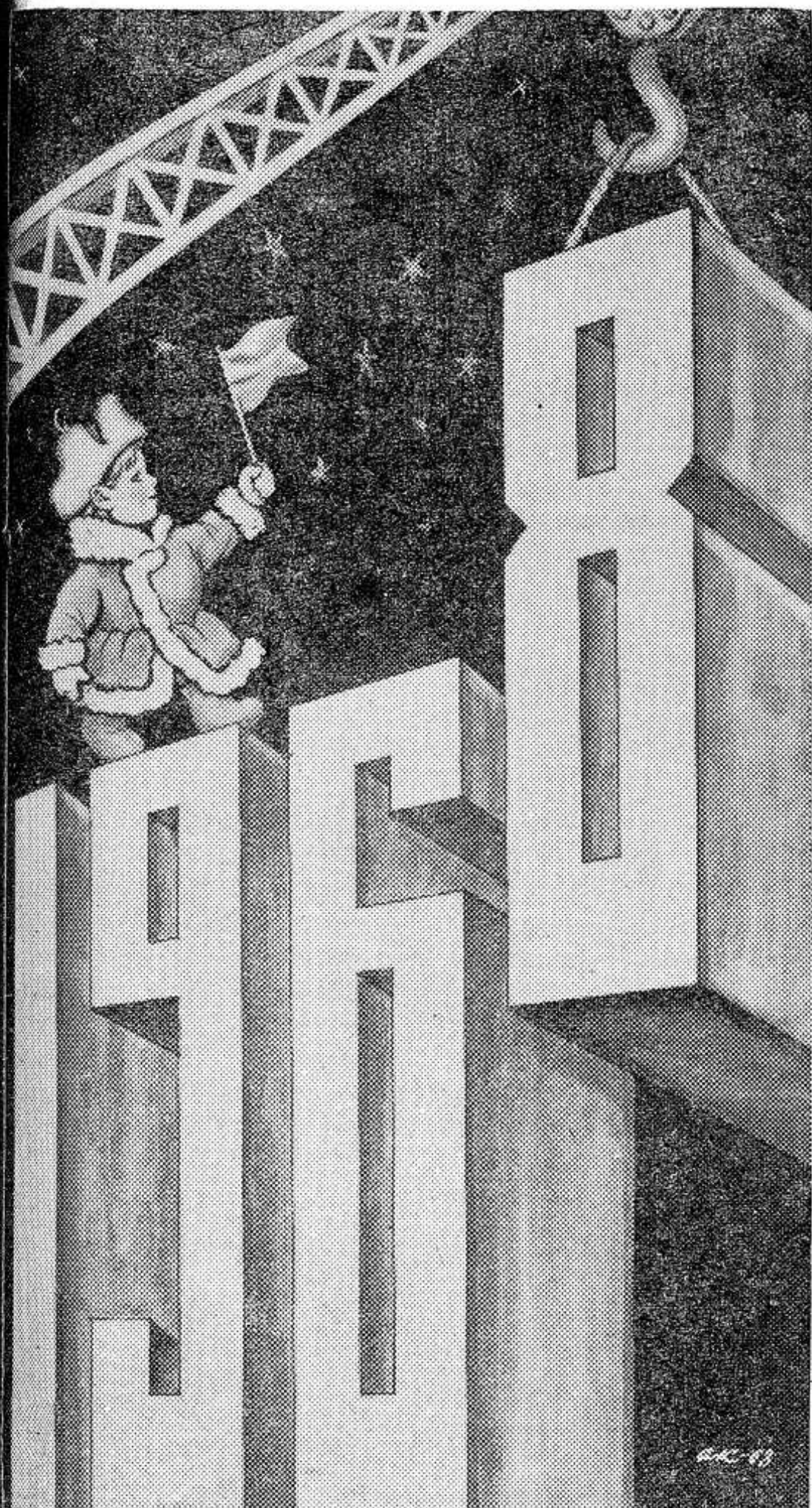
Рисунок художника Ал. Кручины.