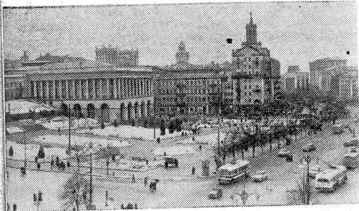
КИЕВ. Центральная магистраль столицы Украины — Крещатик.

За выдающиеся заслуги трудящихся Украинской Советской Социалистической Республики в революционном движении, в Великой Октябрьской социалистической революции и большой вклад в создание и упрочение первого в мире социалистического международного государства — Союза Советских Социалистических Республик, за мужество и героизм, проявленные при защите завоеваний Советской власти, и успехи, достигнутые в коммунистическом строительстве, наградить Украинскую Советскую Социалистическую Республику орденом Октябрьской Революции. Председатель Президиума Верховного Совета СССР Н. ПОДГОРНЫЙ. Секретарь Президиума Верховного Совета СССР М. ГЕОРГАДЗЕ. Москва, Кремль, 22 декабря 1967 г.