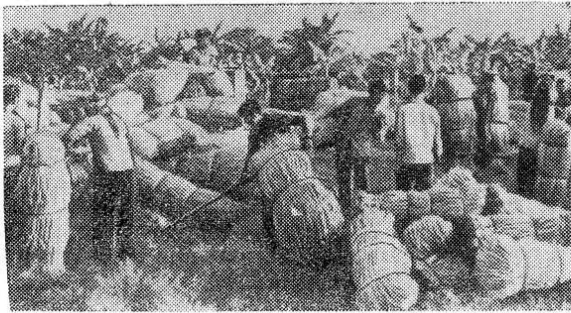
ДЕМОКРАТИЧЕСКАЯ РЕСПУБЛИКА ВЬЕТНАМ. Крестьяне сельскохозяйственного кооператива Тхонг Нхат в пригороде Ханоя собрали по 25 тонн волокон джута с гектара.

Коммюнике призывает народ и вооруженные силы освобождения Южного Вьетнама еще более решительно бороться против врага, чтобы достойно отметить 7-ю годовщину создания НФО Южного Вьетнама.