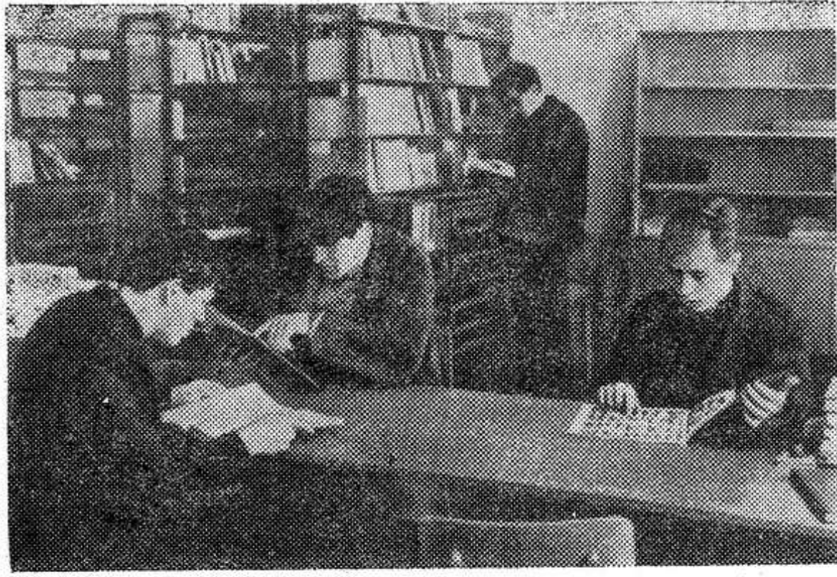
Более чем в 10 раз по сравнению с довоенным временем возросло в Югославии число технических и специальных школ.