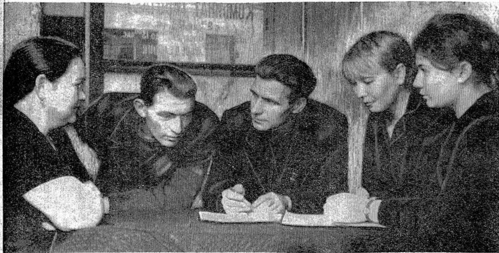
Хорошо работает группа народного контроля комбината бытового обслуживания населения, которой руководит Ген-