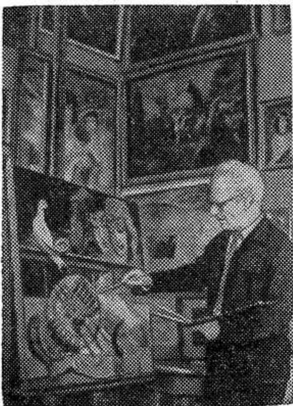
Народный художник Грузинской ССР, лауреат премии имени Ш. Руставели Ладо Гудиашивили за работой.