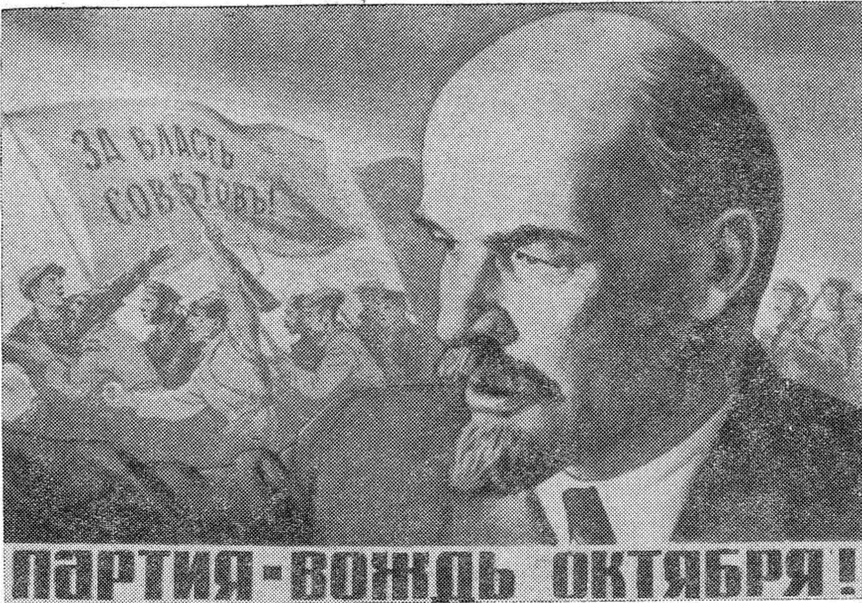
Плакат художника Л. Голованова, выпущенный издательством «Советский художник» к 50-летию Советской власти.