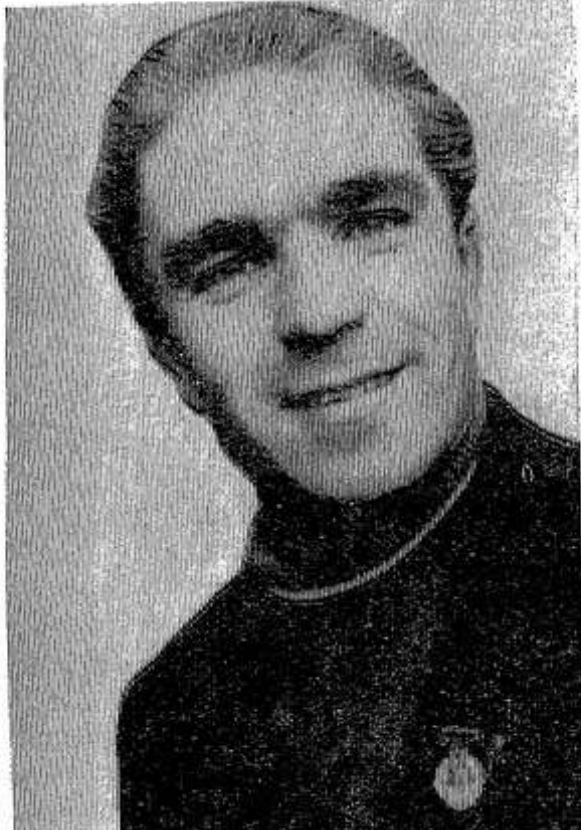
ются неравномерные, с огрехами. Я не хочу обвинять в этом всех наших механизаторов. Обычно так случается у молодежи, недавно севшей за руль трактора или комбайна. Почему говорю об этом? Просто вспомнилось Всесоюзное соревнование молодых механизаторов. До него проходили отборочные соревнования в районах, в областном центре. И всюду были придирчивые судьи. В подмосковном совхозе «Заря коммунизма» мне вручили высокую награду «Золотой колос». Но она, я считаю, по праву принадлежит и старшим товарищам, которые помогли мне освоить профессию механизатора. В Москве я побывал на ВДНХ. Разумеется, посетил павильон механизации. Мне понравился трактор марки «ДТ-74» и некоторые другие новинки сельскохозяйственной техники. Сейчас я готовлюсь к поступлению в сельскохозяйственный техникум на отделение механизации. Сегодня, в День рождения комсомола, мне хочется поздравить всех комсомольцев с праздником и пожелать им больших успехов в труде, отдыхе и учебе. Н. Матвеев, механизатор совхоза «Красный фронтвик». На снимке: Н. Матвеев.

Люди нашей профессии часто спешат побольше вспахать, засеять. Это хорошая черта. Но некоторые в погоне за гектарами забывают о качестве. И этим самым наносят ущерб хозяйству. Допустим, вывел в поле неистинную сеялку, всходы получа-