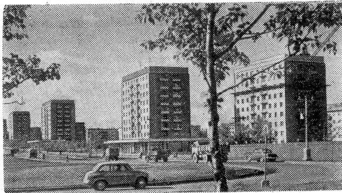
Улица Восточная в Свердловске — одна из старейших в городе. За последние годы она изменилась до неузнаваемости.

строители возводят здесь благоустроенные многоэтажные жилые дома.