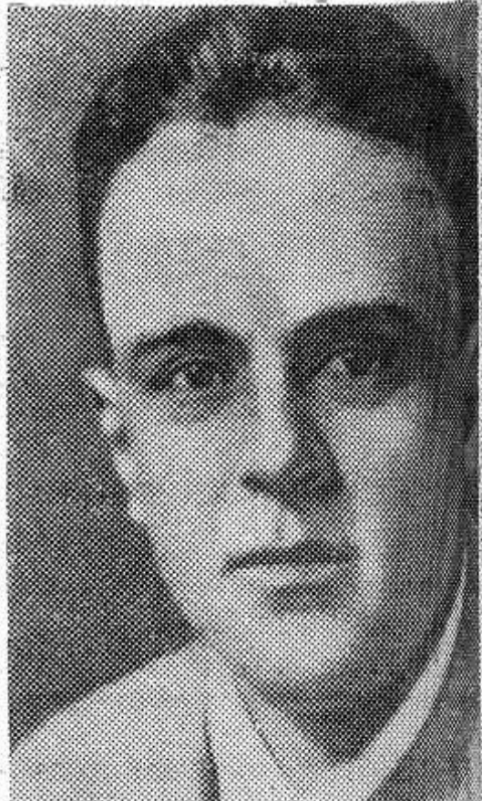
Сегодня исполняется 80 лет со дня рождения Джона Рида (1887—1920), известного деятеля рабочего движения, американского писателя-коммуниста. В книге «Десять дней, которые потрясли мир» он описал события Октября 1917 года, очевидцем которых был.

Джон Рид похоронен у Кремлевской стены на Красной площади.