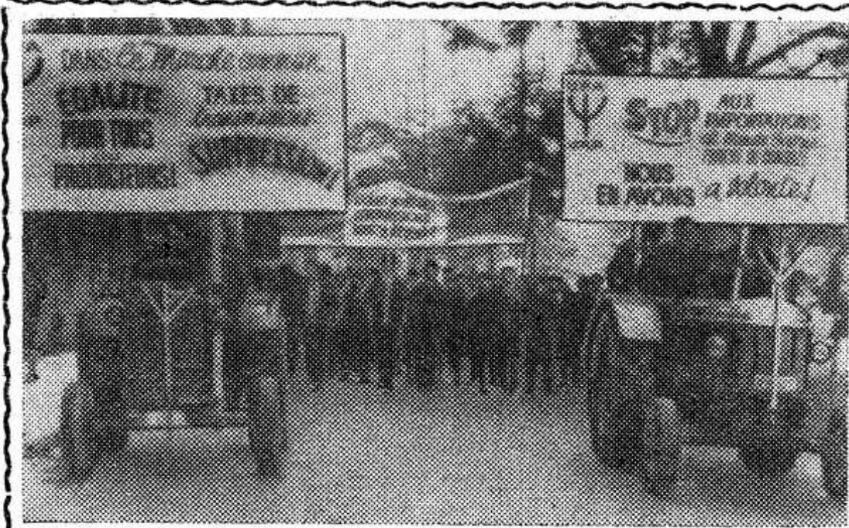
БЕЛЬГИЯ. 15 тысяч фермеров участвовали в демонстрации протеста в городе Льеже. Они требовали прекращения