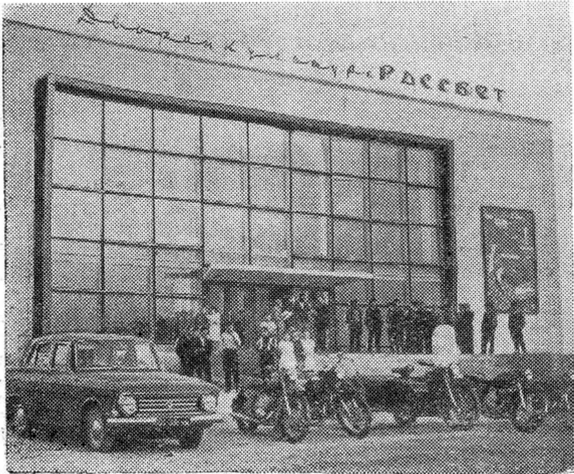
Широким фронтом идет строительство культурных учреждений в республике. В колхозе «Рассвет» Новогрудского района Гродненской области открылся новый Дворец культуры (на снимке). В нем — большой зрительный зал с киноустановкой для показа широкоэкранных кинофильмов, зал для танцев, библиотека, читальный зал, комнаты для работы кружков художественной самодеятельности.

Сейчас важно продолжать начатую работу. Думаем завершить ее к 50-летию Великого Октября, оформить собранные материалы в школьном музее. Л. Фоминых, руководитель краеведческого кружка четвертой средней школы.