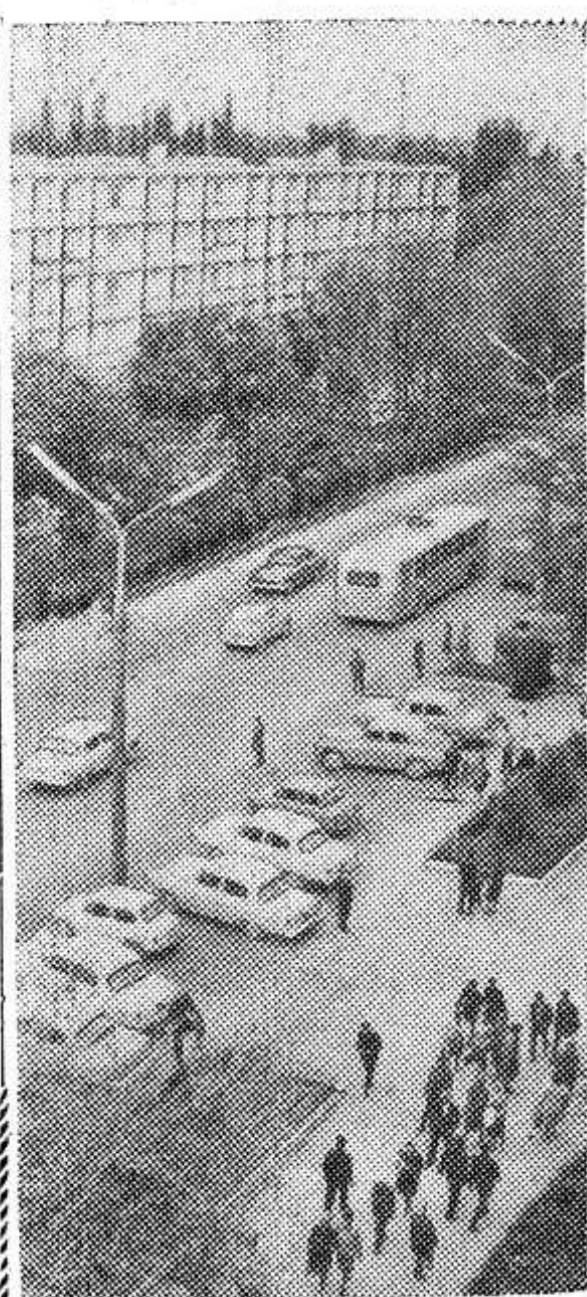
ФРУНЗЕ. Главная магистраль города — улица имени XXII партсъезда.