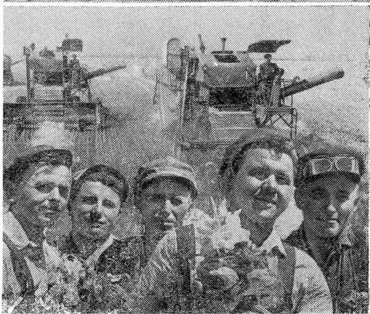
Слава труженикам колхозов и совхозов, самоотверженно работавшим в юбилейном году!