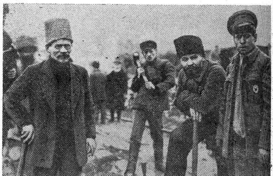
М. И. Калинин и Г. И. Петровский на субботнике

Эта фотография из фондов Центрального Государственного архива кино-фото документов УССР «М. И. Калинин и Г. И. Петровский на субботнике» (автор неизвестен) — одна из работ, поступивших на Всесоюзную юбилейную выставку «50 лет Великого Октября в художественной и документальной фотографии», которая откроется в сентябре на Выставке достижений народного хозяйства СССР.