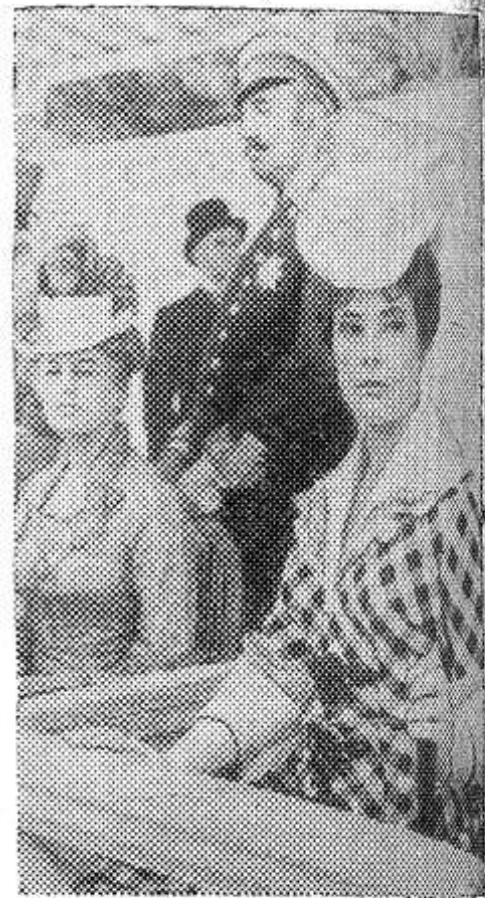
Режиссер Александр Зархи («Мосфильм») заканчивает работу над фильмом «Анна Каренина». В нем заняты Татьяна Самойлова (Анна), народный артист СССР Николай Гринченко (Каренин), Василий Лановой (Вронский), Юрий Яковлев (Стива), Анастасия Вертинская (Кити). Впервые в кино снималась советская балерина, лауреат Ленинской премии Майя Плисецкая (Бетси).