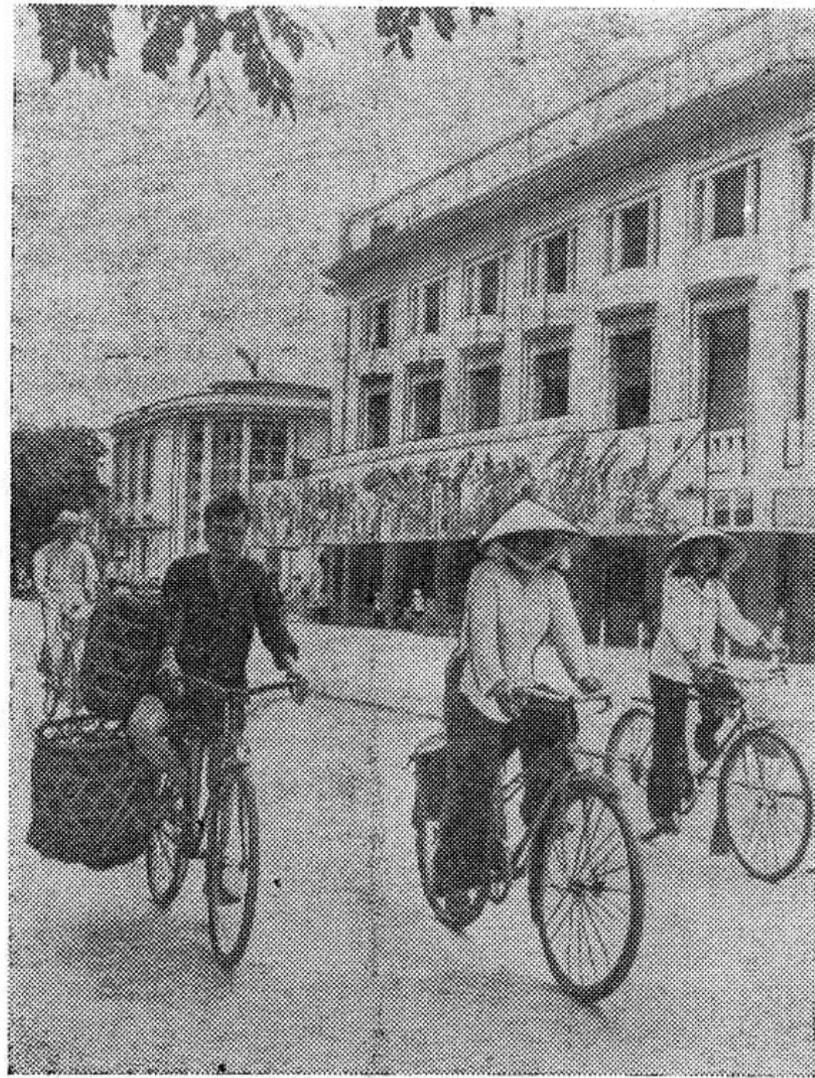
На снимке: на одной из улиц столицы ДРВ — Ханое.