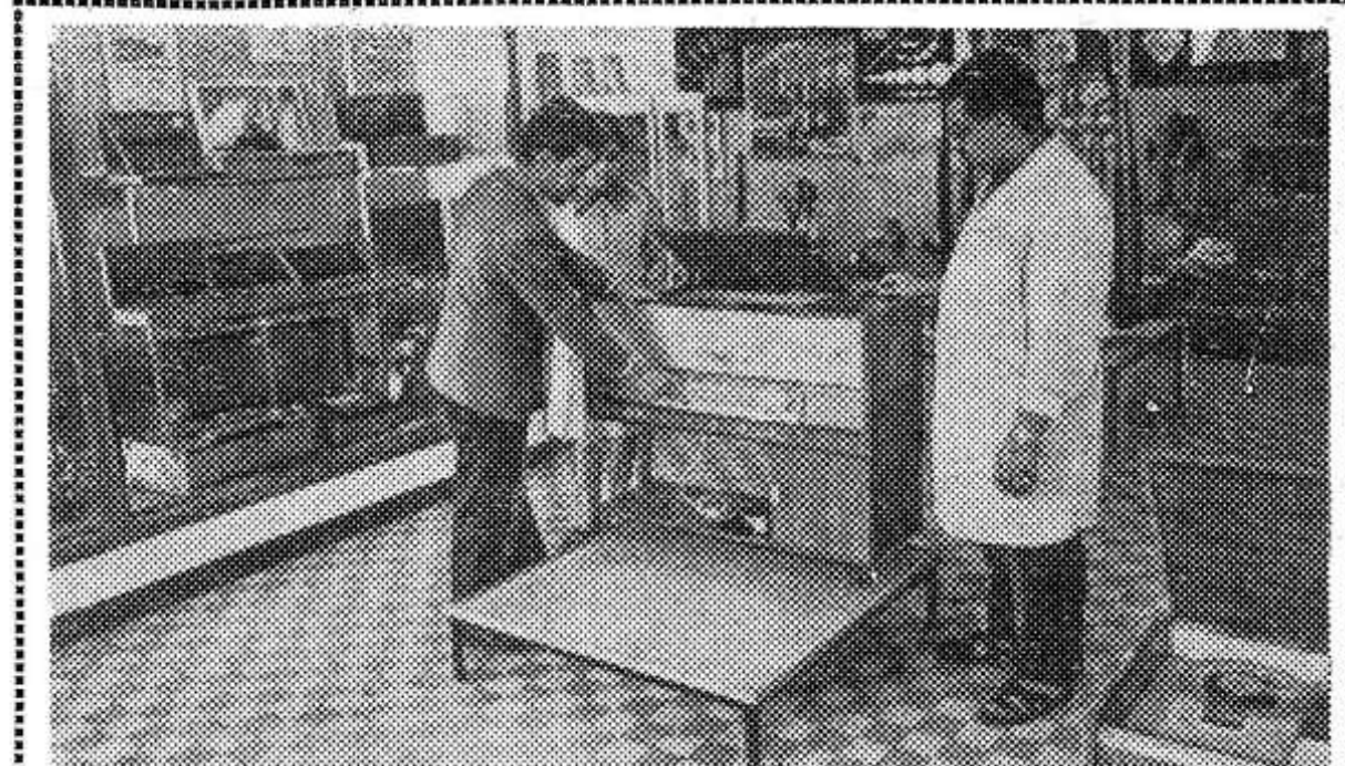
В Алжире третий год работает выставка советских товаров. Автомобили, телевизоры, радиолы, магнитофоны, фотоаппараты, охотничьи ружья и многое другое можно увидеть и купить