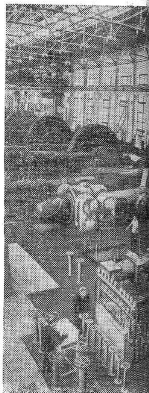
Первенец большой химии Ставрополя — Невинномысский химкомбинат — с каждым годом увеличивает выпуск минеральных удобрений, которые поступают отсюда на поля колхозов и совхозов. За годы работы комбината производство валовой продукции увеличено в семь раз, значительно снижена себестоимость.

Соревнуясь за достойную встречу 50-летия Советской власти, коллектив аммиачного производства за счет улучшения ведения технологического режима сэкономил около 500 тысяч рублей.