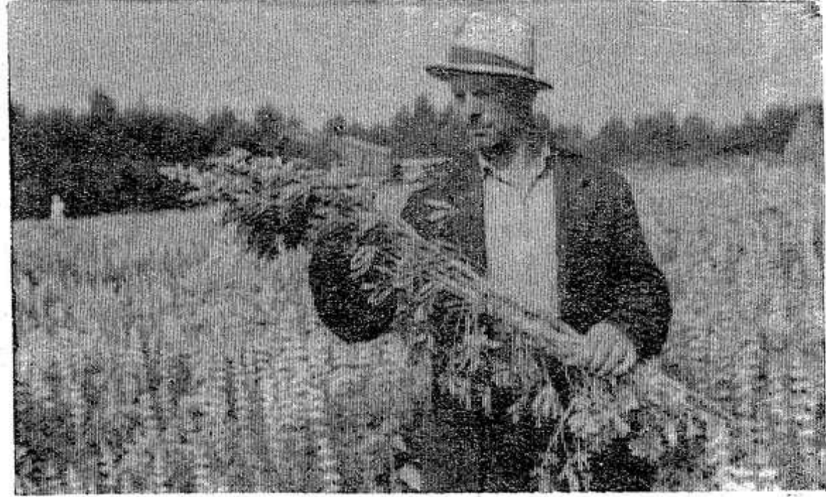
Ни на один день не прекра- щается заготовка сочных кор- мов в отделении Варыгино сов- хоза «Красный фронтвик». Вна- чале скашивали многолетние и естественные травы, а затем в силос пошел люпин.

Из 32 гектаров, занятых лю- пином, скошена и засилосована зеленая масса с 23 гектаров. Урожайность ее составляет 160 центнеров с гектара.