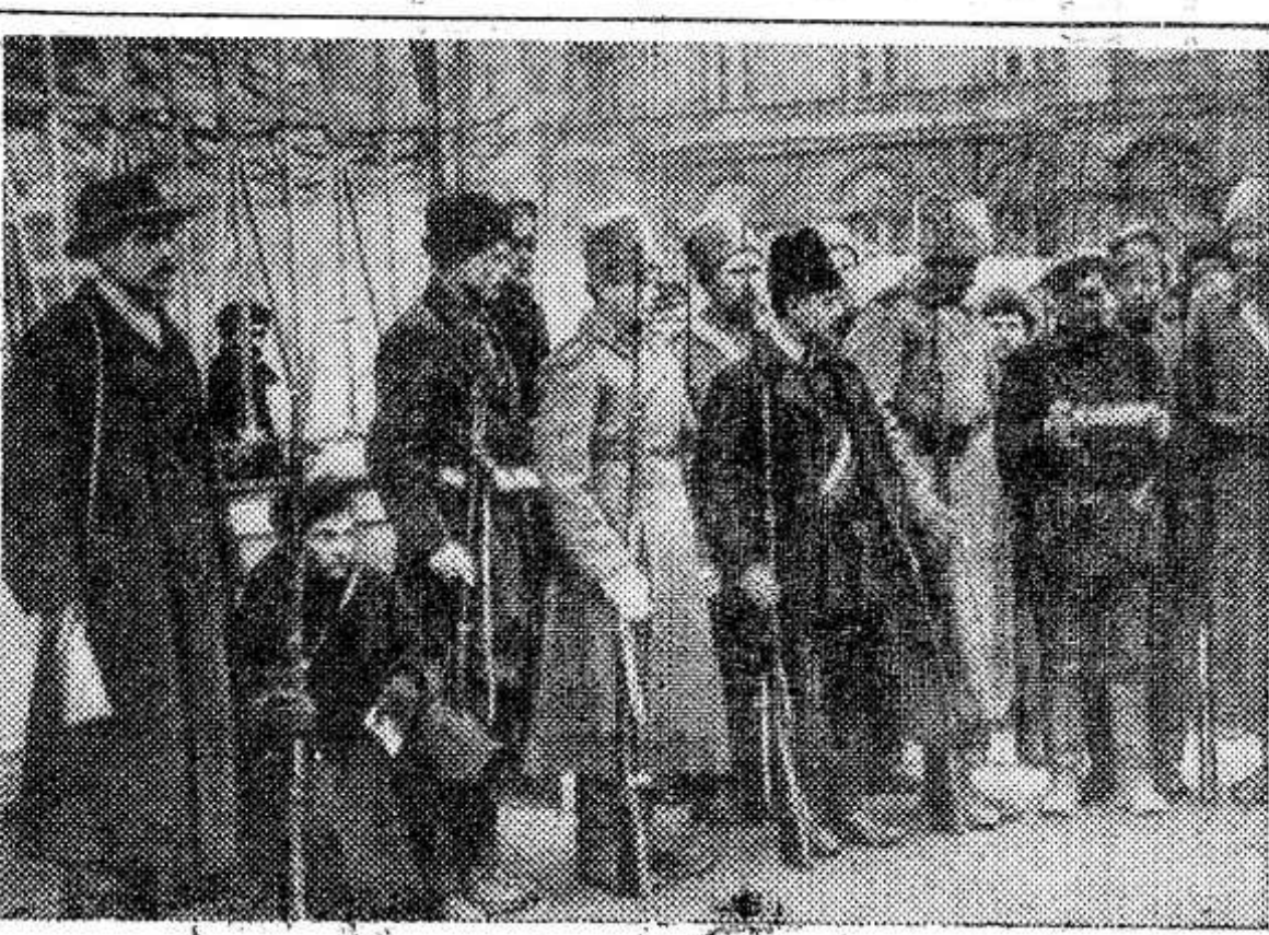
Петроград. Проверка мандатов у Смольного. 1917 год. (Снимок из музея истории Ленинграда). Фотохроника ТАСС.