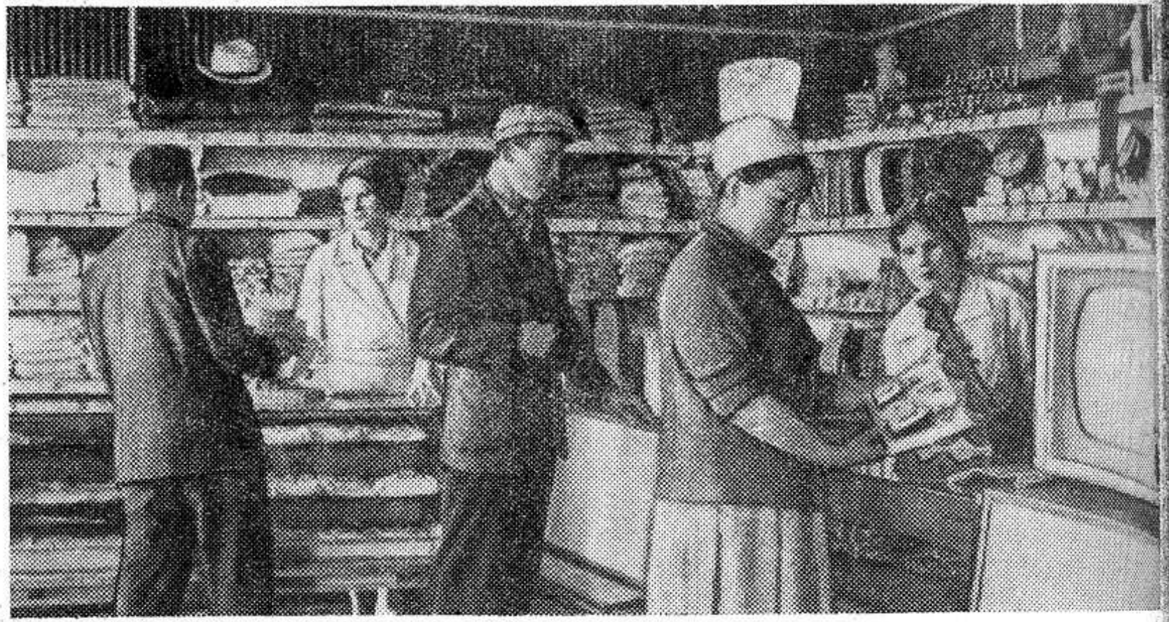
В магазине деревни Карамышево (Тульская область) можно приобрести все необходимое.

влагозарядка сочеталась и с вегетационными поливами, сбор пшеницы достигал 32,6 центнера с гектара. Установлено, что большой эффект дает внесение удобрений на орошаемое поле. Урожайность зерновых возрастает в этом случае еще на 10—12 центнеров. Результаты производственных исследований будут учтены при дальнейшей интенсификации земледелия в районах Поволжья. (Корр. ТАСС).