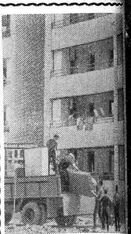
В Ташкенте после землетрясения построен один миллион квадратных метров жилой площади. Ежедневно здесь заселяется более ста квартир. В юбилейном году в новых домах справят новоселье около 40 тысяч семей. На снимке: заселяется новый дом, построенный москвичами на массиве Чиланзар.