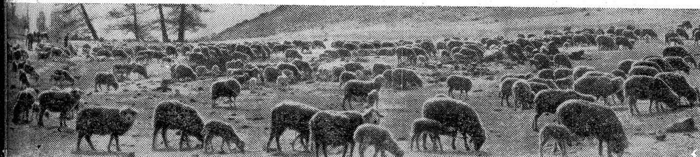
В колхозах и совхозах созданы крупные животноводческие фермы. На снимке: отара овец пятой фермы колхоза имени Кар- ла Маркса на высокогорном пастбище (Алтайский край).