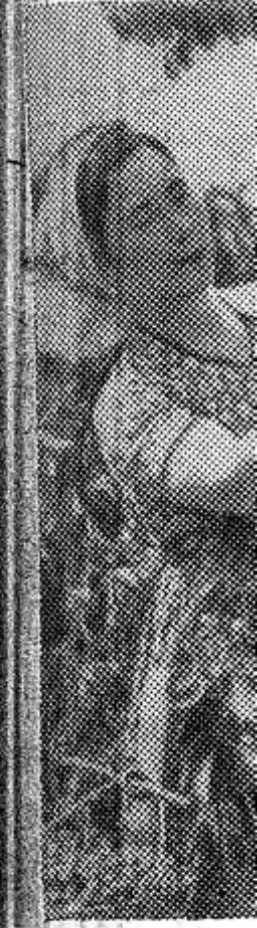
В Молдавии. Этот снимок Кагульского района. На снимке Буторя.