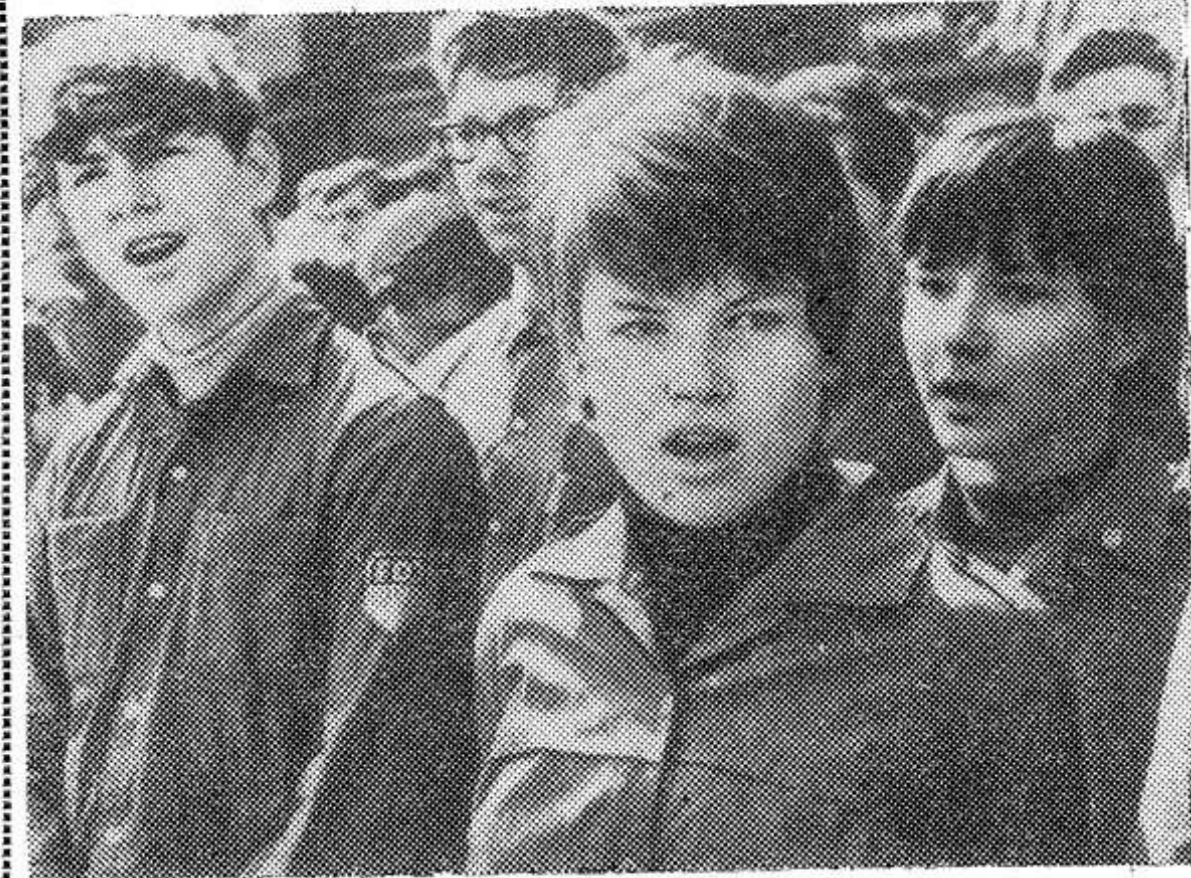
Молодая смена немецких трудящихся, активные помощники строителей социализма в Германской Демократической Республике. Эти юноши и девушки — члены Союза свободной немецкой молодежи. Ныне он объединяет в своих рядах более 1,4 миллиона человек.