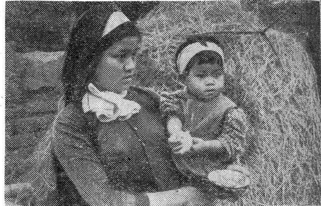
ДЕМОКРАТИЧЕСКАЯ РЕСПУБЛИКА ВЬЕТНАМ. 6 контейнеров с шариковыми бомбами и 10 фугасных бомб сбросили американские самолеты на крестьянский хутор Льемпай провинции Хатой, расположенный вдали от больших дорог и

Открытие сессии в 11 часов в парткабинете райкома КПСС.