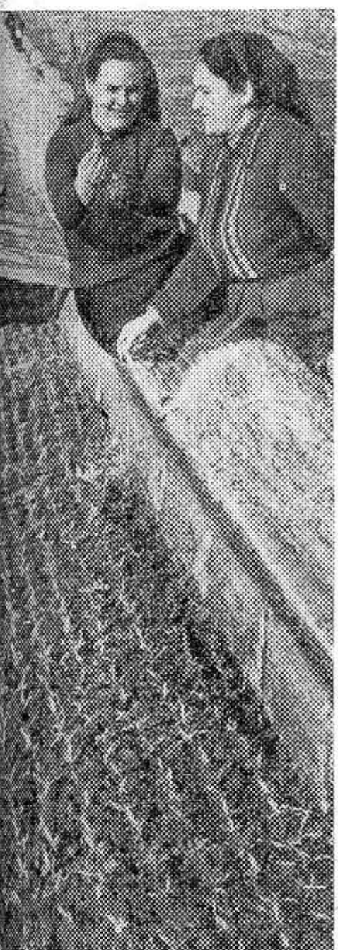
МОЛДАВСКАЯ ССР. Колхоз имени Ленина Тираспольского района — одно из крупнейших овощеводческих хозяйств Приднестровья.

В нынешнем году рассада выращивается в 40 тысячах рам, площадь под орошаемыми грядками составит более 400 гектаров.