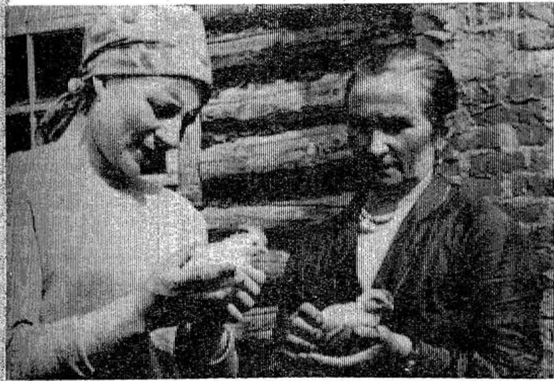
Опочецкий колхоз «XXI партсъезд» имеет птицеводческую ферму и успешно выполняет план-заказ государства на по-ставку яиц.

В будущем количество пернатых будет намного больше, чем нынче. Недавно из Опочецкой циркуляторной станции завезено 12 тысяч цыплят.