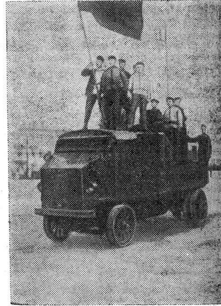
Красногвардейцы на Красной площади в Петербурге. 1917 год.