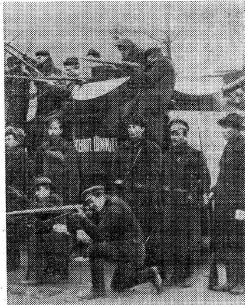
ПЕТРОГРАД. Рабочие, отбившие у войск Керенского броневик «Лейтенант Шмидт». Октябрь 1917 год.