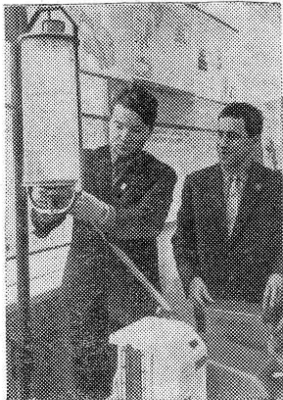
МОСКВА. Во Всесоюзном научно-исследовательском институте электрификации сельского хозяйства в содружестве с сотрудниками Центрального опытного конструкторского бюро Министерства сельского хозяйства СССР создан прибор «МД-1» для учета молока при механическом доении. Он регистрирует количество молока, поступающее в молокопровод.

Опочечкая типография областного управления по печати. Заказ 809. Тираж 7060.