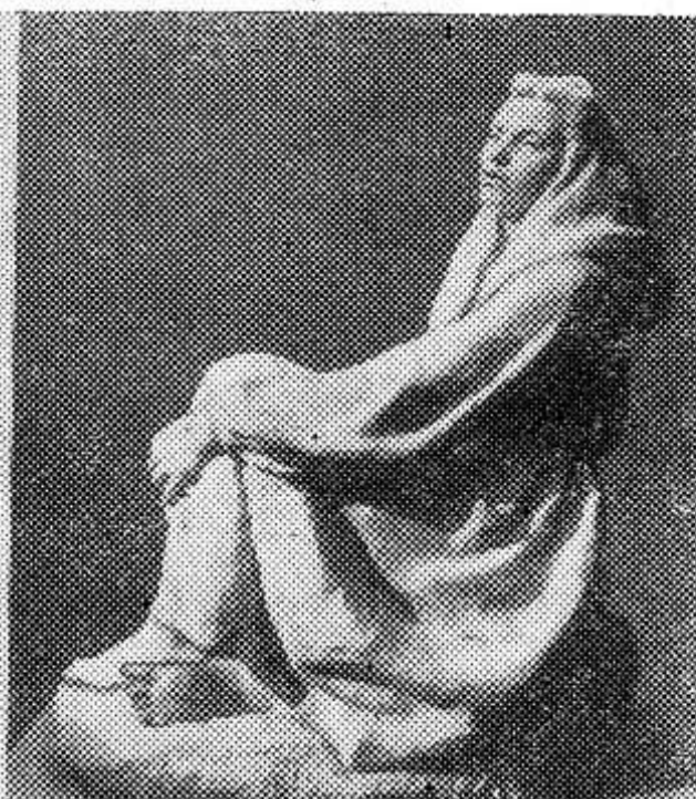
В числе работ, допущенных к участию в конкурсе на соискание Ленинских премий 1967 года — серия скульптур народного художника СССР Е. Ф. Белашовой «О человеке, создающем мир». На снимках: скульптор Екатерина Федоровна Белашова. Работы Е. Ф. Белашовой «Недежда Константиновна Кривская» и «Мечтание».