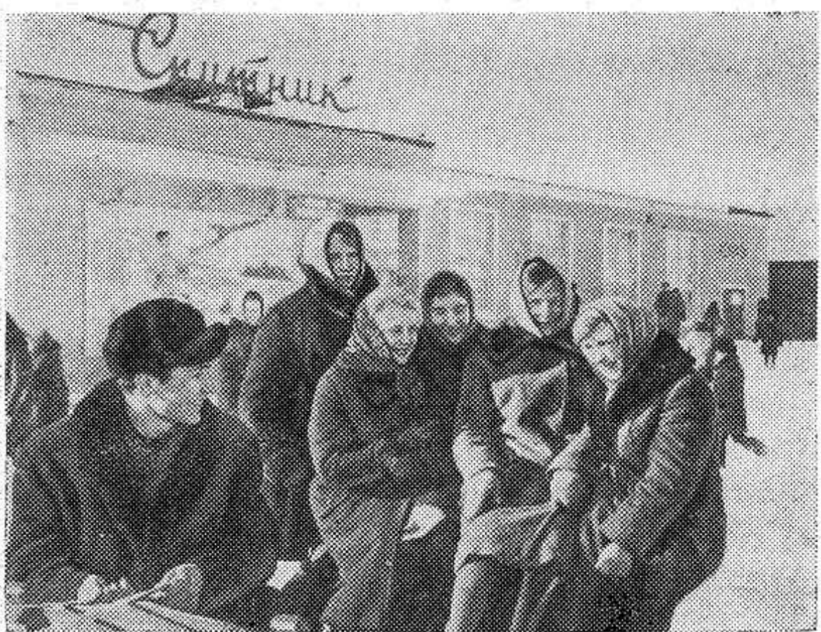
Пятьсот клубов типа «Спутник» будут сооружены к юбилею Советской власти в селах Курской области. Это большое дело взяли на себя комсомольцы вузов Курска и сельские строители. В 300 клубах сельские труженики уже смотрят кинофильмы, выступления самодеятельных артистов.