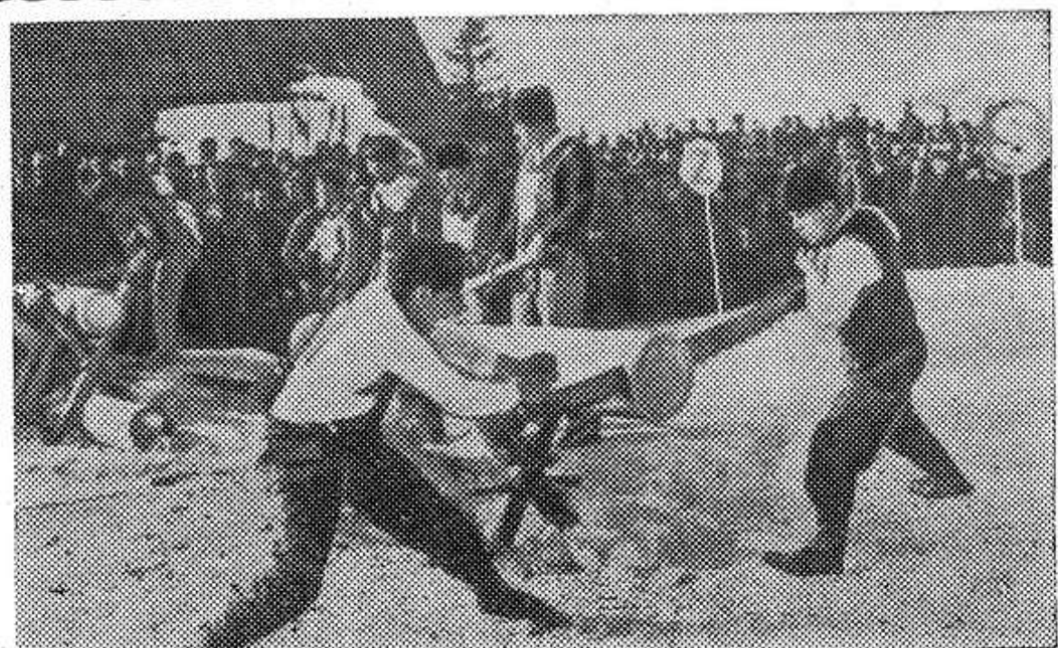
Недавно между жителями двух горных курортных городов Закопане (Польша) и Смоковец (Чехословакия) состоялся интересный турнир. Молодые люди в ярких национальных ко-

50-летие С НЕПЛОХИ... ми выш... рого кварта... Опочецкого и... районов. Они... нили государ... заказы на по... водческой про... Особенно о... досрочное вл... тального план... лока, мяса, и... новоды колхоз... на», «Красн... «Дружба», «... родского райо... мунизму», «... «Победа Иль... района. Вместе с те... довыми хозяй... ном, так и н... есть и такие... нили плана... тов животнов... квартале. К... сятся красн... «Новая жизнь... хозы «Органи... совхоз «Духн... рые другие х... В чем дело... зительные к... животноводы... желают имет... тели в работ... Разумеется, ... ние не всегд... рять в дейст... более, если... проявляют... ской заботы