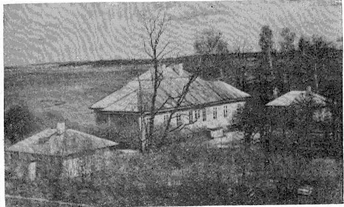
Усадьба А. С. Пушкина в Михайловском.