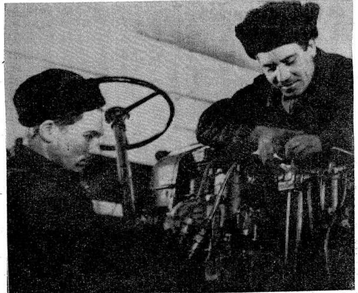
Идет март — первый весенний месяц. По-боевому готовятся к встрече юбилейной весны механизаторы совхоза «Красный фронтовик». В хозяйстве завершается ремонт тракторов и прицепного инвентаря.

К дню выборов в Советы они пришли не с пустыми руками. Досрочно выполнен квартальный план продажи основных видов продуктов животноводства. На приемные пункты из хозяйства поступило 798 центнеров молока и 371 центнер мяса. Успешно выполняется и план продажи яиц государству.