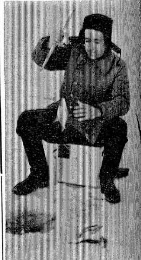
РЫБАЦКОЕ СЧАСТЬЕ. Зам. редактора Ф. Е. АНИТОВ

Н. Польский и другие. Всего шесть подписей. г. Опочка.