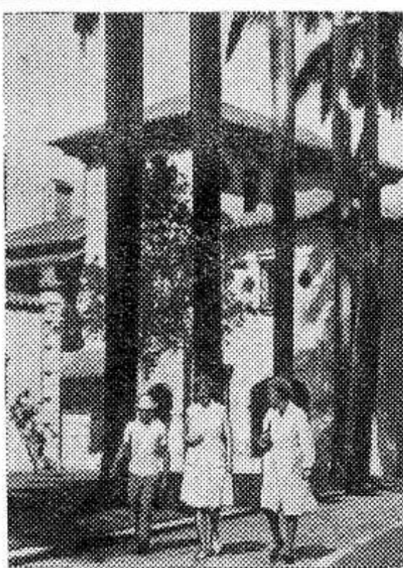
РЕСПУБЛИКА КУБА. Научно-исследовательский институт имени Александра Гумбольдта начал работать близ Гаваны. Его создание было предусмотрено соглашением между правительством ГДР и Кубы, подписанным в декабре 1965 года.