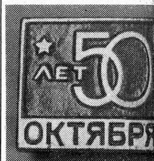
Московский завод «Победа» приступил к выпуску юбилейных значков, посвященных 50-летию Советской власти.

На снимке: новые значки.